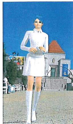
Weiß-blaue Lilli vor dem Ausstellungsgebäude auf der Mathildenhöhe.

Darmstadt - eine Filmreise durch die Kultur der Stadt: Die DVD ist zum Preis von 6,90 Euro bei Info & Ticket Darmstadt, Luisenplatz 5, zu kaufen.